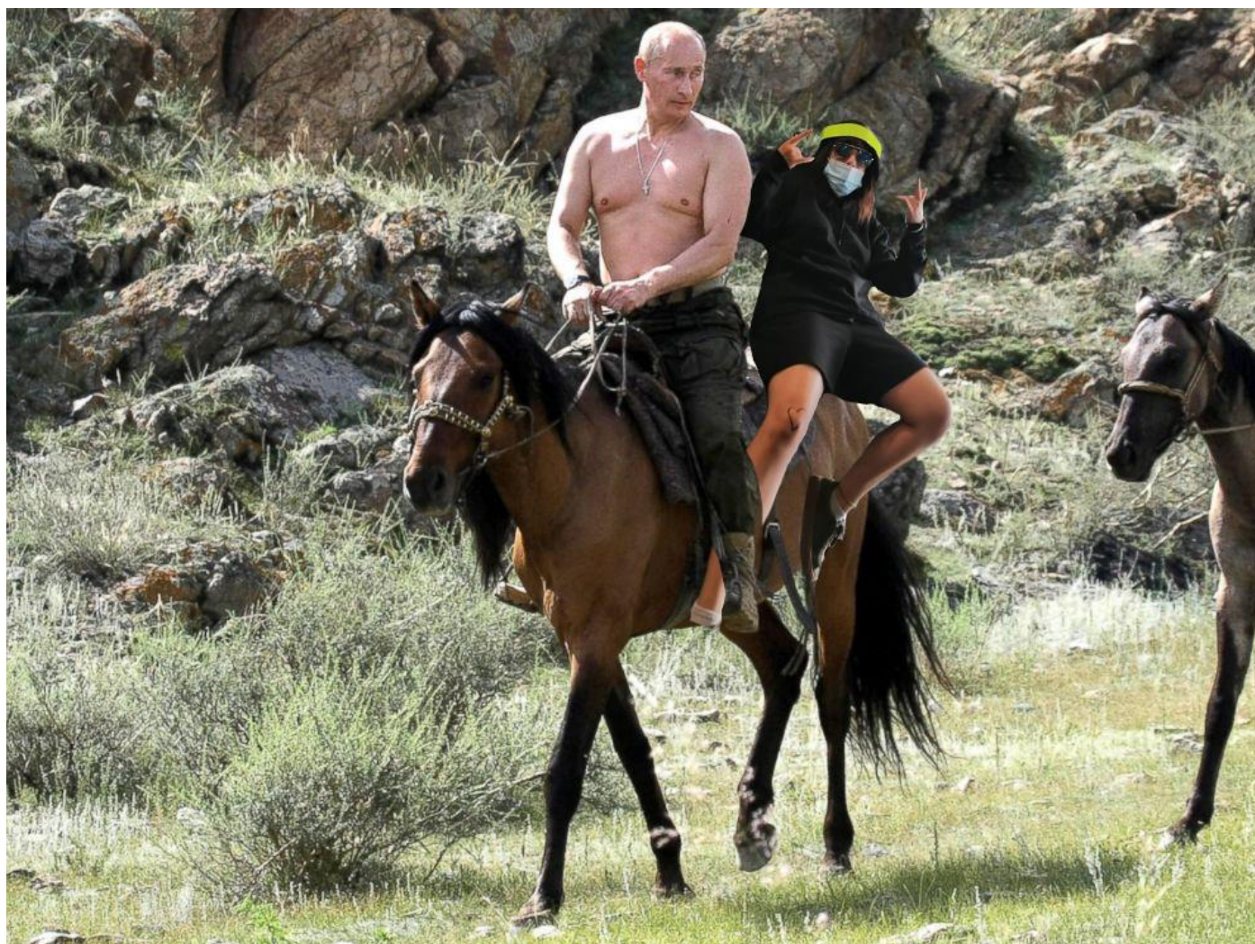
Photo réalisée sans trucage