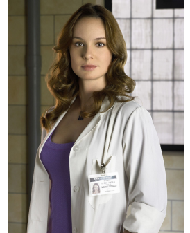
Toi, jeune arrivant(e) en P2 qui vient de récupérer sa blouse et qui tape la pose pour papa maman