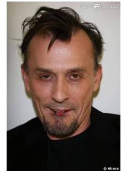
"Chehhh je suis pas tombé dans votre piège"