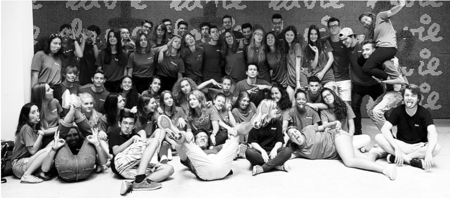
L'équipe du Tutorat Niçois en 2017-2018

Tu peux prendre avec toi des fiches que tu as confectionnées durant la P1, tes schémas etc... Ils peuvent aussi te demander de préparer en avance une présentation d'un point d'un cours de la matière qui te plaît pour leur montrer ta façon d'expliquer. Tout cela te permettra de leur montrer que tu es quelqu'un de sérieux. 4 - Quelques jours après l'entretien tu reçois un appel pour te confirmer ou pas ton nouveau rôle de tuteur d'une des matières que tu as demandées et tu connaîtras le nom de ton ou tes co-tuteurs. 5 - Une journée de formation avant la première tut' rentrée t'attend afin que les chefs tut' vous précisent, à toi et aux autres tuteurs, ce qu'ils attendent de vous et comment vous pouvez au mieux vous organiser, mais aussi comment fonctionne le Forum des Carabins Niçois.