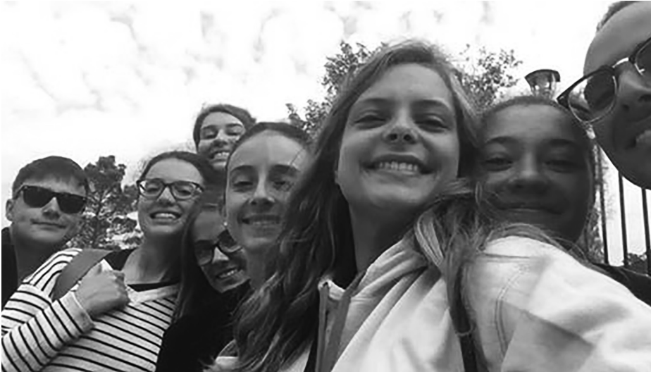
Ma co-tut qui porte fièrement le pull de la Biostat, ainsi qu'une foule d'admirateurs

Alors non, ce n'est pas le plus beau, mais il fait partie de notre folklore ! Ce pull, c'est l'occasion de souder les différentes générations de tuteurs, et on en garde un très bon souvenir. On a très hâte de rencontrer les futurs tuteurs de biostat et d'organiser